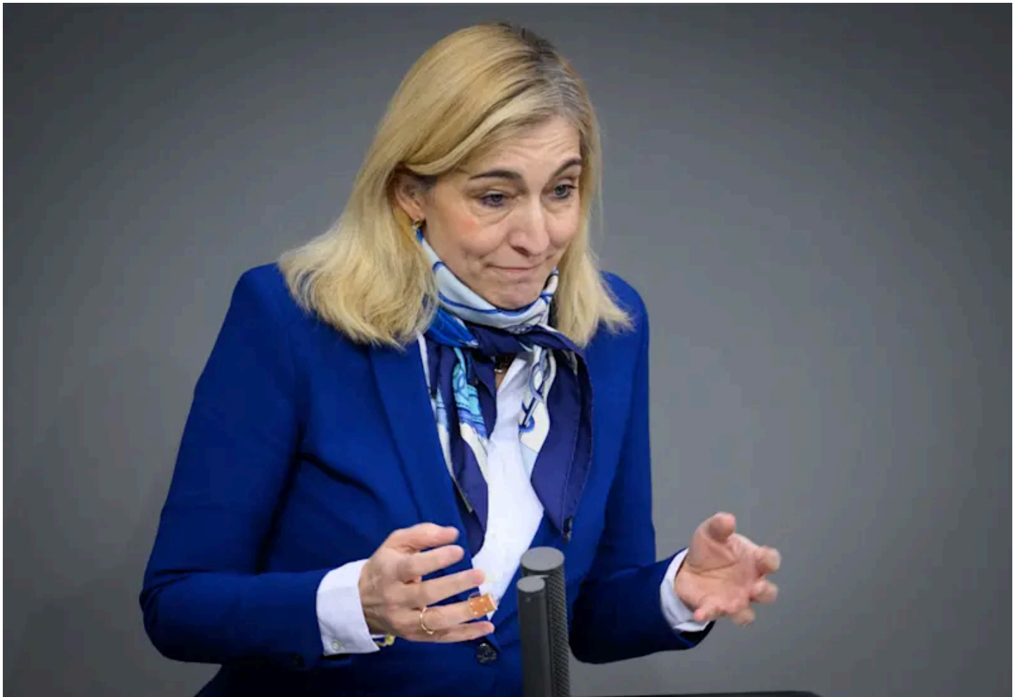
Gesundheitsministerin Nina Warlen, 30.01.2026

Nehmen Sie die festen Einzelzimmerquoten in manchen Bundesländern. Sie treiben die Bau- und Betriebskosten massiv nach oben. Warum sollte es Menschen nicht möglich sein, sich bewusst für ein günstigeres Zweibettzimmer zu entscheiden?